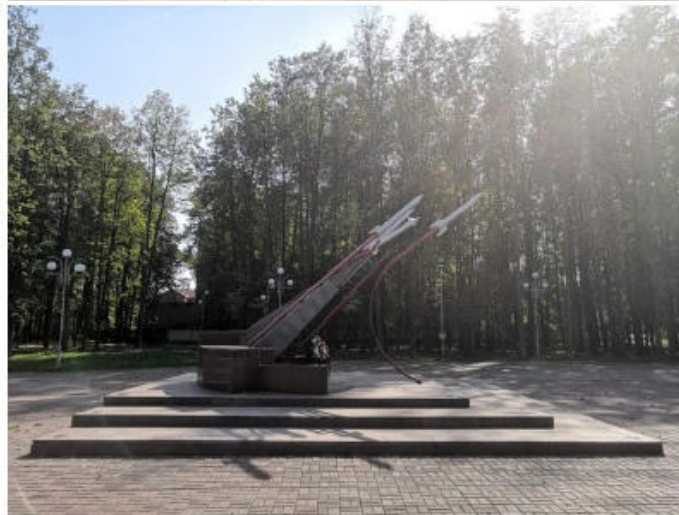
Пример правильно сделанных фото для БД